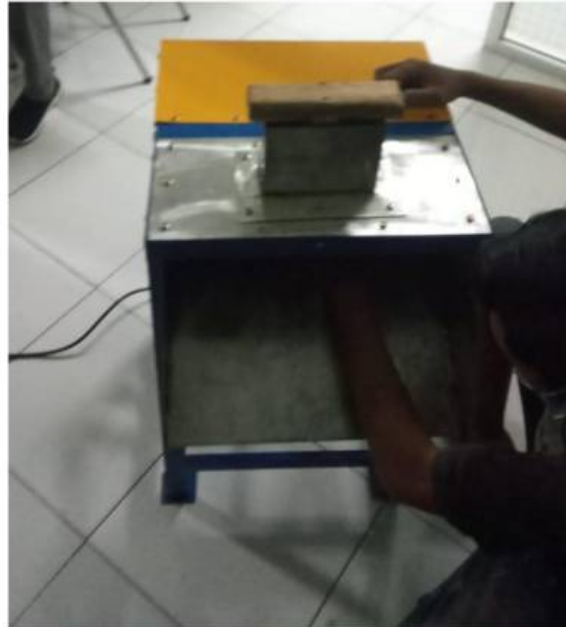
Gambar 2. Mesin Pengiris Pisang

berputar secara horizontal. Tenaga penggerak menggunakan motor listrik menggunakan belt untuk menggerakkan pulley pisau pengiris.