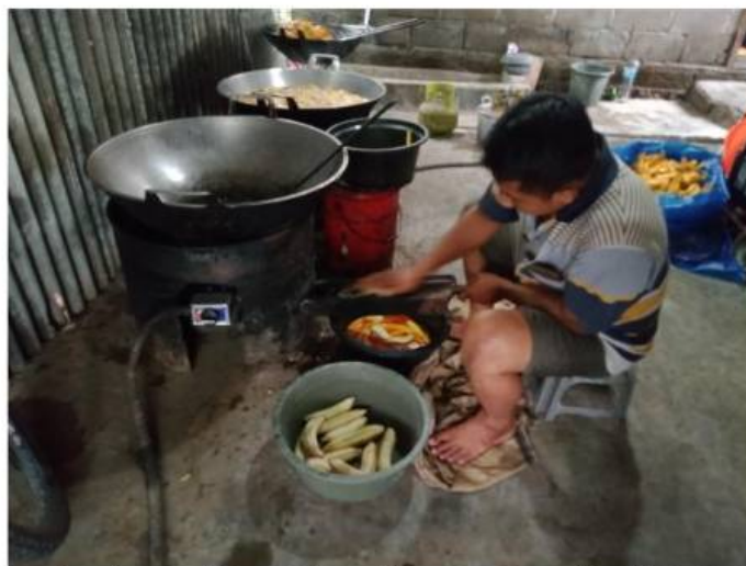
Gambar 1. Pengirisan Pisang Menggunakan Alat Sederhana

Produksi keripik pisang di UKM masih menggunakan peralatan sederhana. Karakter irisan pisang yang digunakan adalah irisan pisang memanjang bukan berbentuk bulat. Pengirisan ini dilakukan menggunakan tenaga manusia dan peralatan pisau tipe geser (Gambar 1.). Penggunaan peralatan ini membatasi produktivitas keripik sehingga UKM belum maksimal dalam memenuhi permintaan pelanggan.