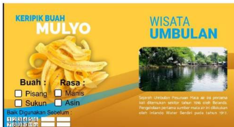
Gambar 3. Desain Kemasan Keripik Buah Mulyo dengan Penambahan Atribut Pariwisata

1 dilibatkan dalam penilaian kualitas dan persepsi ketertarikan. Sasaran responden yang dikehendaki adalah generasi milenial, mengingat anak muda saat ini didominasi oleh mereka. Desain kemasan baru dapat dilihat pada Gambar 3.